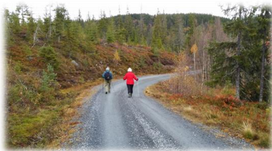
På vei til skihytta

Vi oppfordrer deg som er glad i turorientering til å dele gleden med en eller flere som du unner en god opplevelse. Ta dem med ut i skogen, gi dere god tid. Nyt naturen og gjerne litt medbragt niste og kaffe. Håper dere deler bilder med oss; #turoverdald