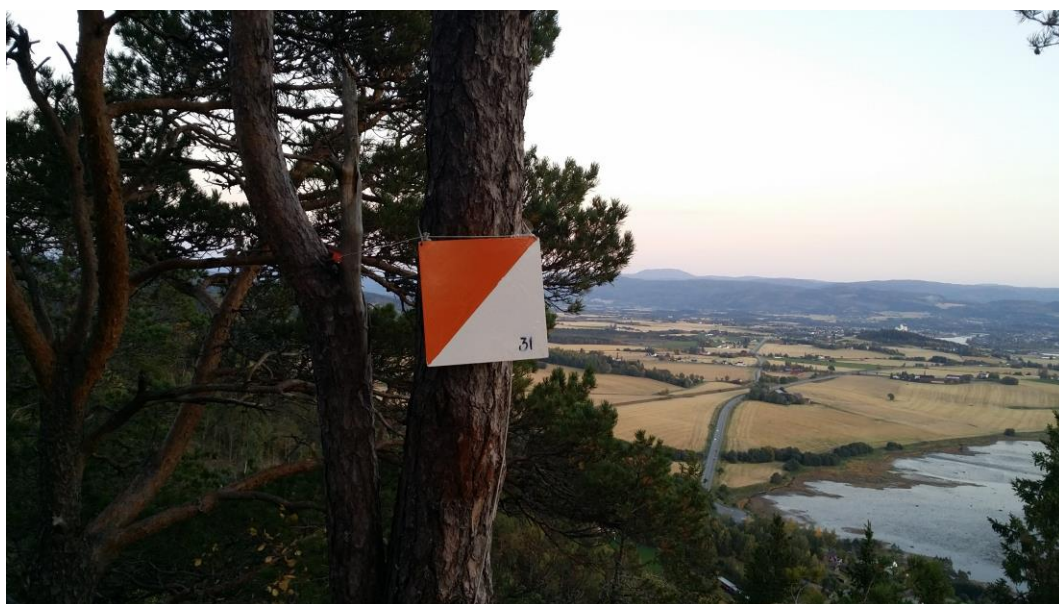
Høgkammen i 2017