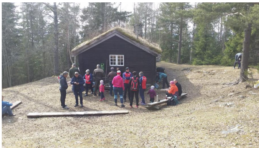
Fra fjorårets åpningsdag på Nordbergshaugen

Mellom klokka 15.00-17.00 er det tradisjonell åpning. På grunn av sen snøsmelting har vi valgt å servere kaffe nesten i fjæresteinene. Stolpe 4 i årets stolpetrim står ved Ørin feltstasjon. (Kjør Hamnevegen og ta av til høyre ved skilt Russervegen. Ta så av til venstre v/ Industriveien. Passer forbi Trones Bruk mot Kværner. Veien svinger der mot høyre og feltstasjonen ligger i enden av veien. God parkering langs veien). Møt opp til en trivelig o-prat. Salg av tur-o-konvolutter. Oppmøte gir 2 ekstrapoeng .