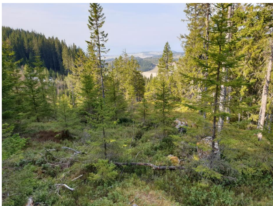
Utsikt fra årets post 32 på Volhaugen