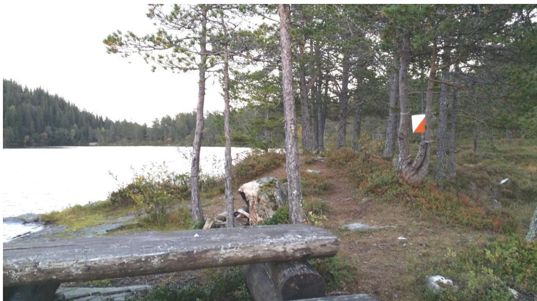
Ved Haukåvatnet. Her vil du finne post 34 i år

Vi oppfordrer deg som er glad i turorientering til å dele gleden med en eller flere som du unner en god opplevelse. Ta dem med ut i skogen, gi dere god tid. Nyt naturen og gjerne litt medbragt niste og kaffe. Håper dere deler bilder med oss; #turoverdal