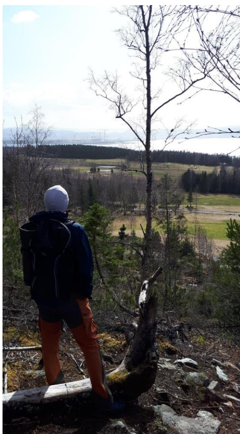
Utsikt fra årets post 9 på Trones